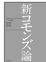
新コモンズ論 -幸せなコミュニティをつくる八つの実践- 中央大学出版部、2016

「テーマコミュニティの森-ヒューマンサイズの新しい都市」(ぎょうせい、2002)