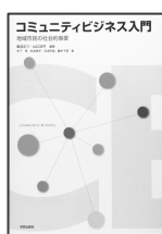
コミュニティビジネス入門 -地域市民の社会的事業- 学芸出版社、2009