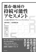
都市・地域の持続可能性アセスメント -人口減少時代のプランニングシステム- 学芸出版社、2015